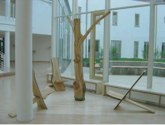
FRANZISKUSFIGUR IN DER PAUSENHALLE