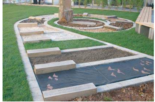
BARFUSSWEG IM INNENHOF