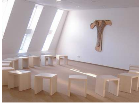
TAUKREUZ IM MEDITATIONSRAUM