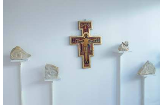
FRANZISKANISCHES KREUZ + SANDSTEINAugen