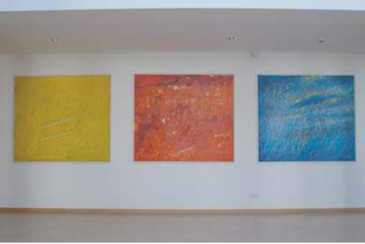
KUNST IN DER PAUSENHALLE (PROF. GIRKE)