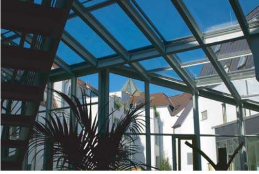
PAUSENHALLE MIT BLICK AUF DEN DOM