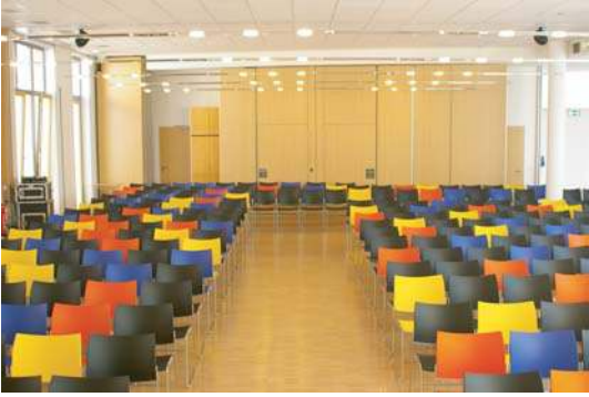
AULA MIT FARBIGER BESTÜHLUNG